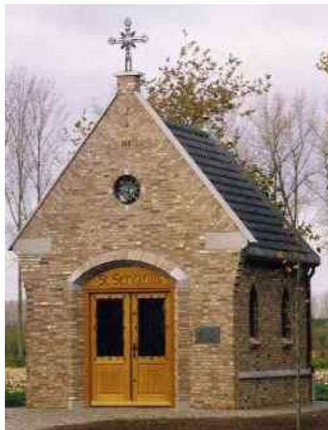
De Servatiuskapel aan het Ginderdoor.

In de wintermaanden wordt de repetitie van het koor gehouden in het Dorpshuis en in de