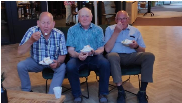
Een extra stuk gebak voor de organisatie.

den we diverse stopplaatsen o.a. bij Koningshoeve in Berkel Enschoot, de Bockenrijder en museum Peerke Donders in Tilburg. Over het algemeen was het weer prima, maar op dinsdag en woensdag hadden we toch een flinke bui. Gelukkig wel steeds als we toevallig net op een terras zaten. De avonden werden op een gezellige manier doorgebracht. Er werden spelletjes gedaan, maar ook gewoon gekletst. Op de laatste avond was er een traktatie in de vorm van een gigantische slagroomtaart om onze tiende fietsvakantie ludiek af te sluiten. Veel te snel was onze fietsweek weer voorbij en fietsten we weer richting Lieshout. Hopelijk volgend jaar weer. Een tevreden deelnemer.