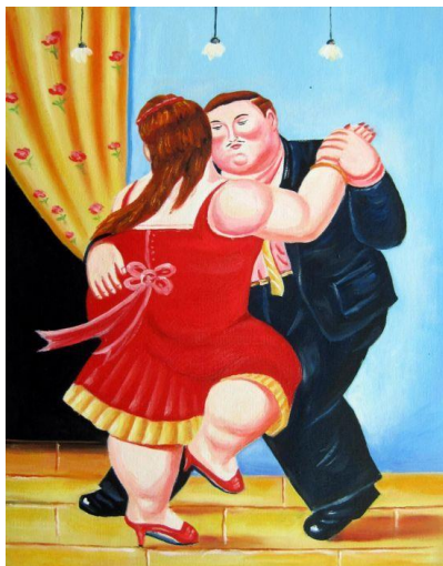
Werk van Fernando Botero.

Ook in het seizoen 2022 – 2023 zal er weer een lezingreeks Kunstgeschiedenis gehouden worden via zoom. Op onze website kunt u het volledige programma zien. In het kort geven we dit hier weer: